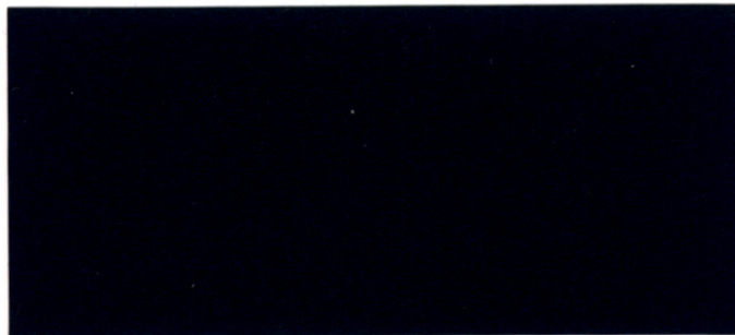
●ダークブルーパール(417)