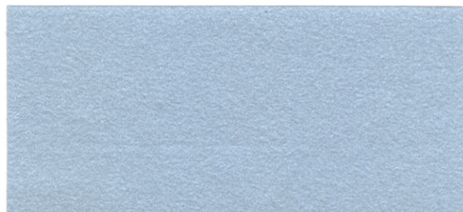
●シルバーメタリック(426)