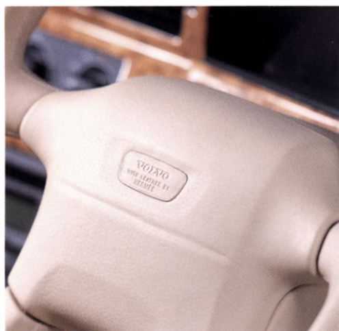
エルメスのエンブレム、それは最高品質とエレガンスの証。

1837年創業以来、ヨーロッパ装飾工芸の練達と最高品質の代名詞として、人々の憧れの的となってきたエルメス製品。とくに、19世紀の華麗な高級馬具作りに始まったエルメス社の皮革製品は定評があり、“ケリーバッグ”の例を挙げるまでもなく数多くの逸品を世に送り出しています。そこでボルボでは、伝統的品質と技術、そして何よりもエレガンスを重んじるエルメス社製本革を、ボルボの最高級車S90ロイヤルサルーンのインテリア素材として採用。トップ・オブ・ボルボの洗練されたインテリアデザインとエルメスの気品あふれる本革仕上げによる車室内は、ヨーロッパ伝統文化の粋を感じさせるエレガントな佇まいと最高の乗り心地をお約束できるでしょう。